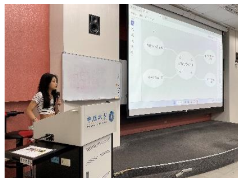
▲11 月 23 日學生簡報 3 之 3(GQ393A)