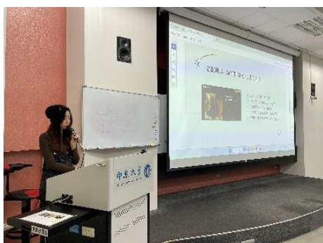
▲11 月 23 日學生簡報 3 之 2(GQ393A)