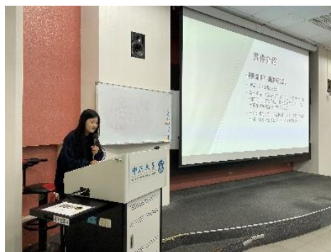
▲11 月 23 日學生簡報 3 之 1(GQ393A)