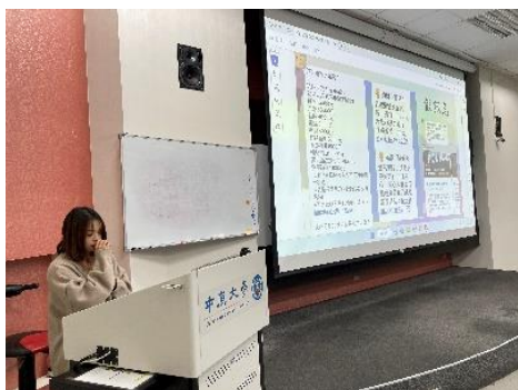
▲11 月 23 日學生簡報 3 之 2(GQ393BR)