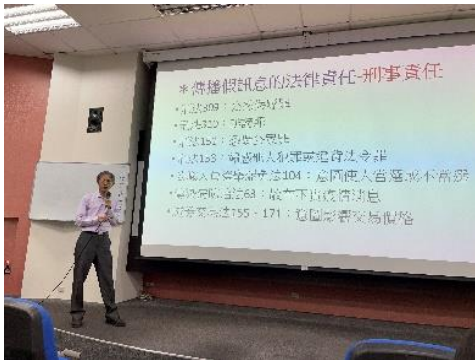
▲10 月 12 日課程講解(GQ393BR)