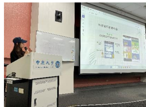
▲11 月 23 日學生簡報 3 之 3(GQ393BR)