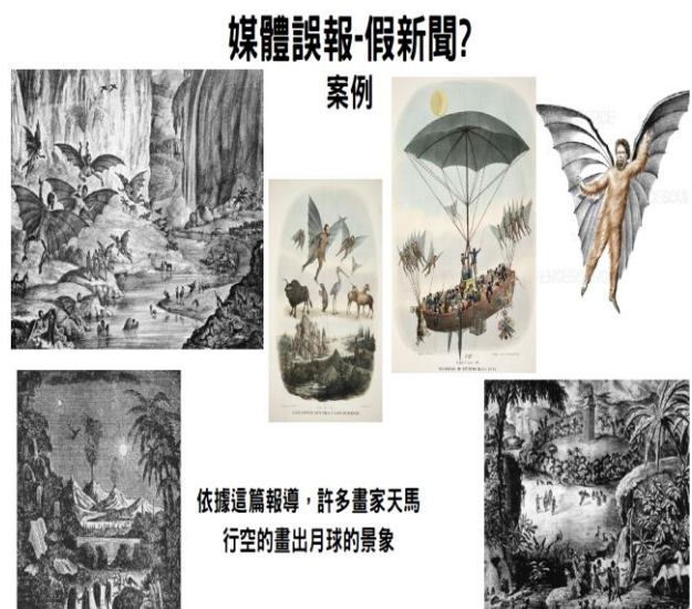
▲以 1835 年紐約太陽報的月亮觀察報導為案例向同學說明假新聞並非當代獨有之現象