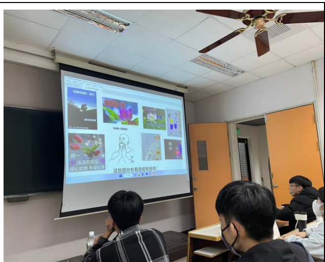
▲向同學說明長輩透過 Line 群轉傳的早安圖其實是長輩數位社交的嘗試，同學應予以鼓勵並善意回應。