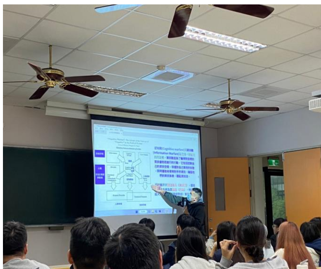
▲以北約組織 NATO 的研究向同學說明認知戰同步還蓋了人類領域與技術領域